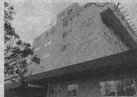
ホンダロジコム本社(春日井市)

システムは、各従業員から集めた休暇希望日の申請の入力や、1日分の作業に必要な作業量予測、各人の対応可能スキル・得意スキルの組み合わせ、必要なら事業拠点間の人員の融通など、ほぼ全工程をAIが代行する。熟練者が合計時間で丸1日かけていた作業の大半が、わずかなデータの調整・更新を除き自動化・ペーパーレス化された。